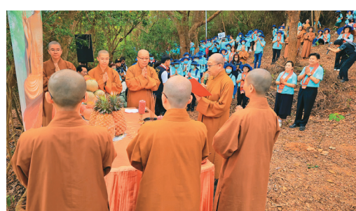
↑在玉里佛光園地，慧開法師領眾恭讀星雲大師〈為自然祈願文〉。