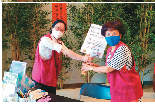
國際佛光會洛杉磯協會哈崗分會、羅蘭一分會共6位佛光人，在西來學校提供三「截」義服務。