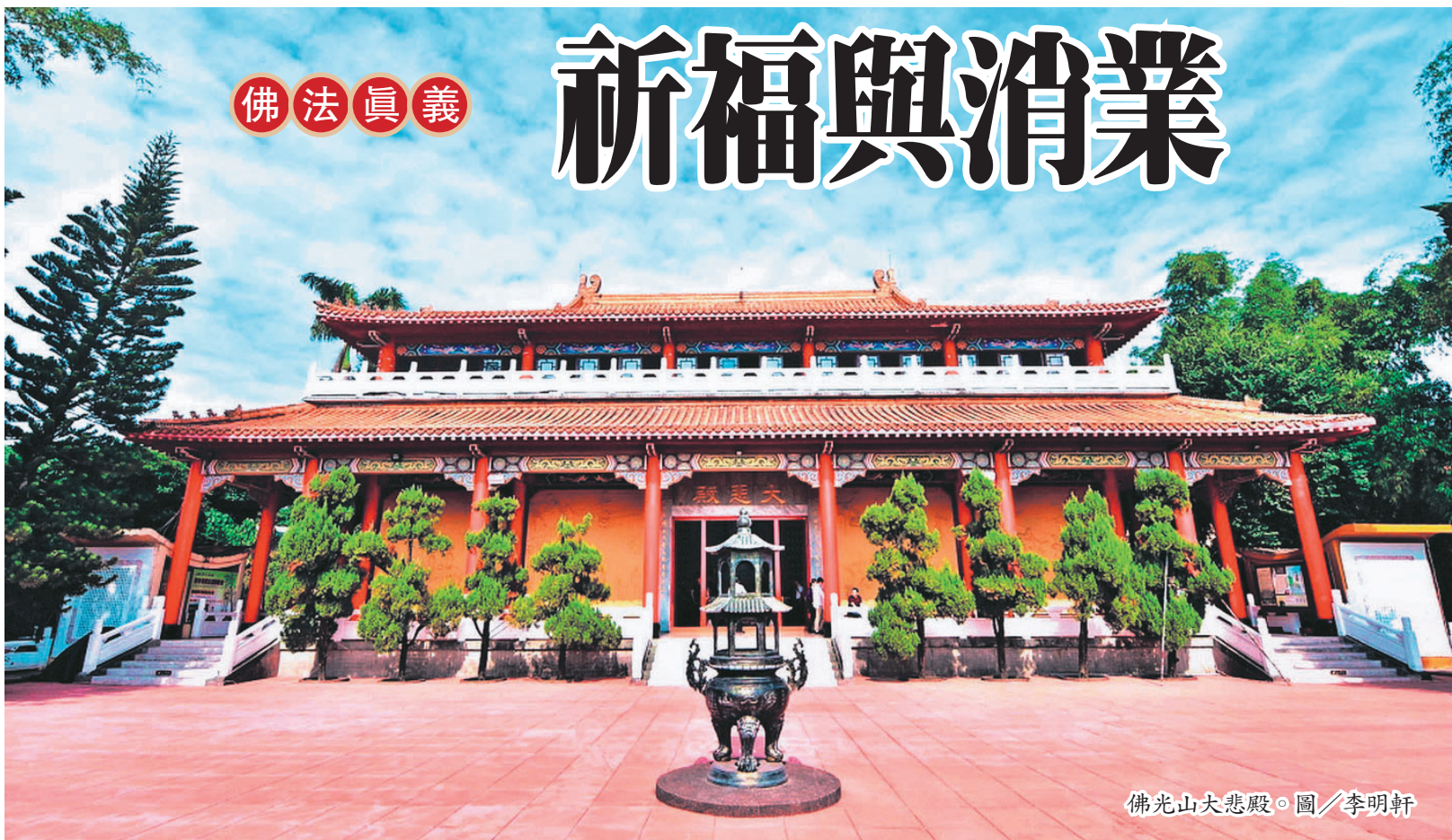
佛光山大悲殿。