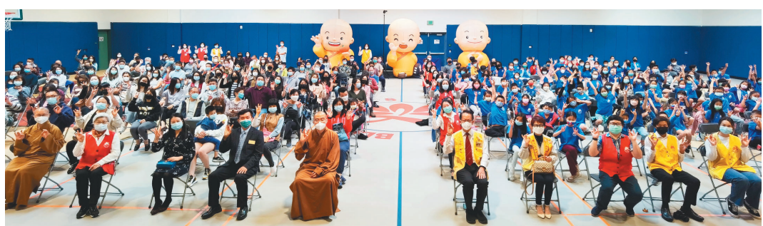
佛光西來學校結業典禮大合照。

在典禮中，頒發「成績優良獎」表揚40位學生，同時為辛勤教導、無私奉獻的老師及義工菩薩頒發獎狀，以及感謝家長的護持，特別為周六班家長頒發全勤獎。西來學校於2021年獲准成為「美國總統義工