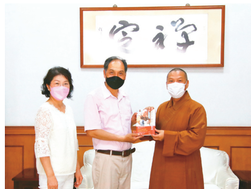
圖 / 人間社記者李生鳳