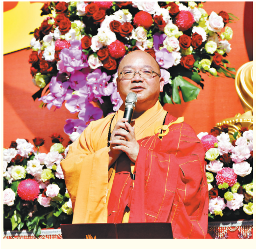
「2022年百年好合·佛化婚禮暨菩提眷屬祝福禮」，佛光山住持心保和尚證婚。他期勉新人互相尊重包容。