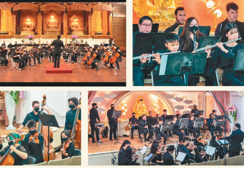
佛光青少年交響樂團演出「2022年新年音樂會」。