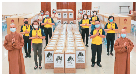
大馬佛光人僧信二眾，合力把防疫物資、氧氣機裝箱，送往機場倉庫。

雖然募集到物資，但隨著疫情繼續惡化，各國暫停往返印度航班，大馬政府4月28日宣布禁止讓印度航班往來。佛光人不斷透過各個管道，包括聯繫印度佛光人進