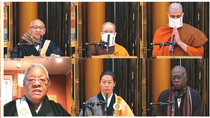
↑東本願寺洛杉磯分院舉行佛教祈福儀式，邀請6位代表不同佛教傳承的法師，以「六度」波羅蜜為主題，向大眾開示。