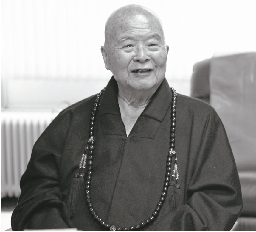
星雲大師提倡人間佛教理念，以「佛光普照三千界、法水長流五大洲」，奠定佛光山將佛法弘揚全世界的基礎。

【記者陳玲芳台北報導】「釋迦牟尼佛住哪裡？住在心裡，如果你的心裡有嫉妒、憎恨、貪欲，這個佛祖住在這裡能安穩嗎？他坐不住啊！」《佛教靠我》影片中，佛光山開山星雲大師強調「自己是自己的神明，自己是自己的雕刻師」，但有的人不知將自己雕塑得更美、更好，隨便糟蹋自己很可惜，不是神明保佑我們，而是自己該如何「做自己的神明」。