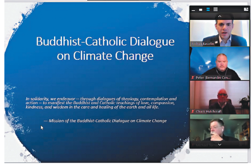
第1屆「天主教佛教對談諮詢委員會會議」線上舉行，佛光山西來寺妙靈法師（左上）代表出席。