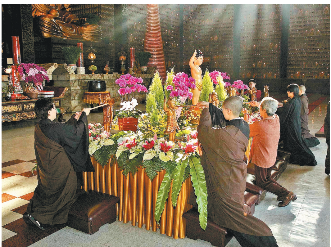
▲佛光山今年首次推出「雲端浴佛」，有別以往在大雄寶殿設置浴佛池的情景。