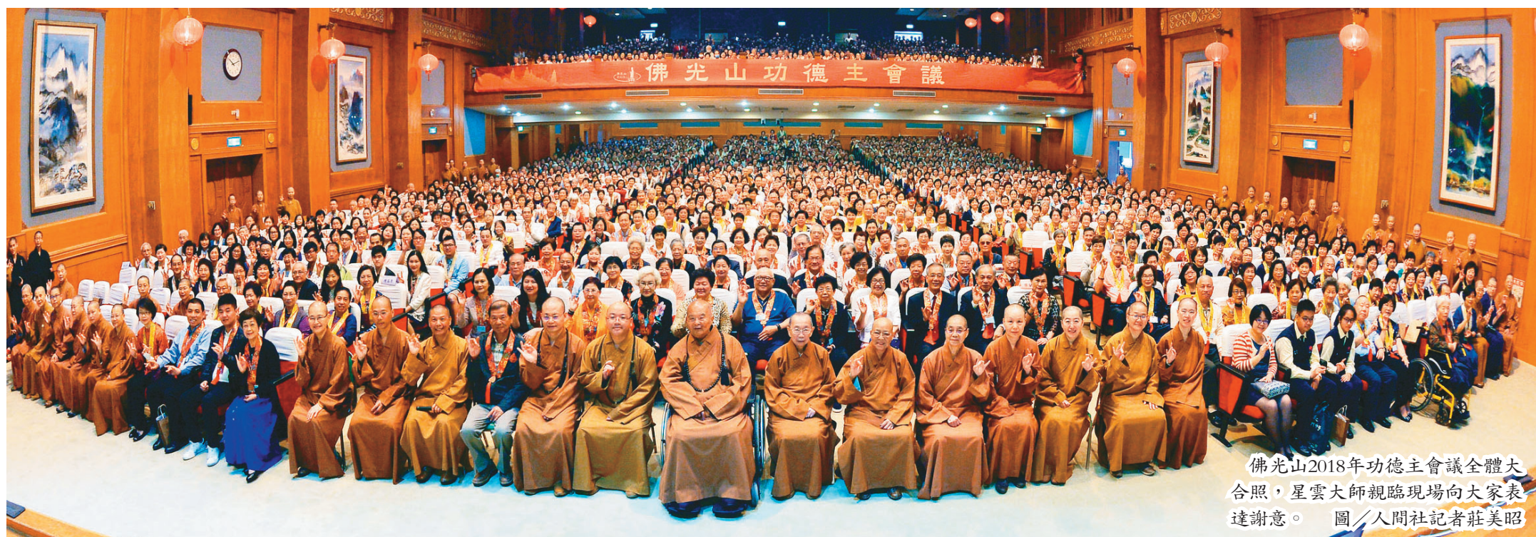
佛光山2018年功德主會議全體大合照，星雲大師親臨現場向大家表達謝意。

在大師的鼓勵支持之下，覺誠法師帶領佛光人在印度清奈設立「佛光希望之村」，改善村民生活，並舉行皈依儀式；在斯里蘭卡、印度大吉嶺、尼泊爾興辦「三好學堂」，為失學的青少年，提供受教育、翻轉生命的契機。