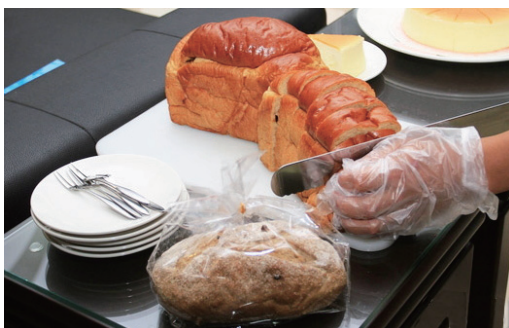
不斷的努力學習鑽研，各式的麵包、點心都難不倒他。

須花費更多時間；他每天只睡四個小時，下課回家後要先把接單的麵包製作完成，並且不斷練習考試項目，他能考上乙級證照，對許多更生人而言，是一個很好的學習範例。