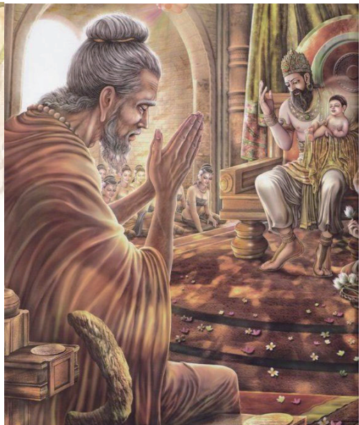
阿私陀仙預言：太子若繼承王嗣，將是統領四天下的一位稀有的聖君；若出家必能成為人天的導師——最尊最貴的佛陀。

「學者！你又怎麼知道他將來會喜愛寂靜而且會出家呢？」淨飯大王懷疑地問。學者指著太子說道：