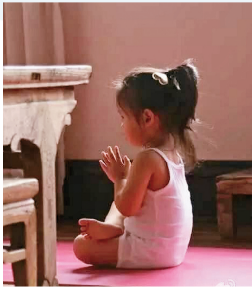
↑孫儷的女兒拜佛靜坐。

拍《甄嬛傳》時當從道具工作人員那兒得知，小白貓拍戲完後沒人耍時，孫儷馬上決定把他抱回家收養，以免牠成為流浪貓。拍攝《新上海灘》時，孫儷收養劇組的一隻小貓，並取名為「程程」。