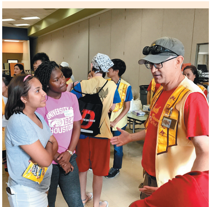
↑上月底颶風哈維造成德州地區豪雨成災，佛光山中美寺投入救援行動。