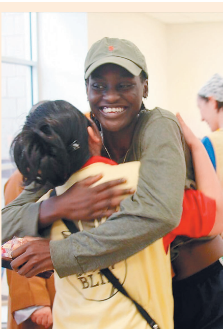
↑當地民眾擁抱義工，感謝他們不分你我，無私地予以協助。