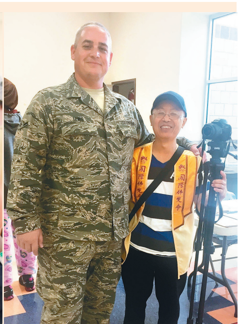
↑佛光義工和軍人們同心協力，為當地民眾重整家園。