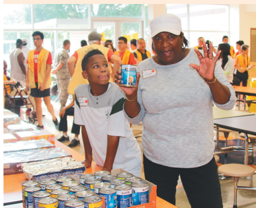
↑民眾歡喜地拿著賑災物資，感謝中美寺提供住所及各界的幫助。

【人間社記者心渡休士頓報導】德州有史以來最大的颶風哈維，上月25日挾著時速215公里4級颶風威力登陸，並降下近9兆加侖雨量的記錄，災難性豪雨造成當地滿目瘡痍，休士頓呈現癱瘓狀態，德州東南部數個市鎮洪水成災。