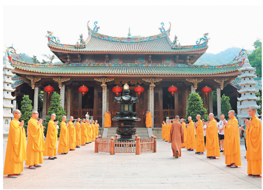
↑ 閩南佛學院師生在大殿前列隊排班，等候迎接台灣佛教界代表來訪。