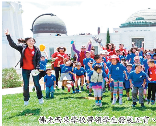
佛光西來學校帶領學生發展五育、養成三好品德。