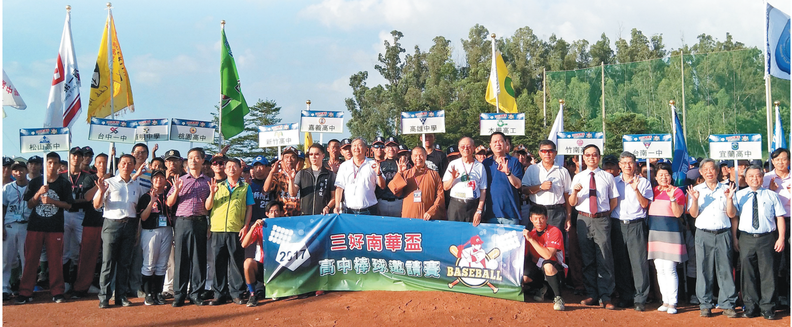
▲第一屆南華盃高中棒球邀請賽開幕典禮，十六支參賽球隊與現場貴賓合照。