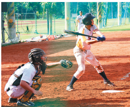
▲南華盃邀請台灣的高中職乙組社團棒球隊，共同實踐三好運動。