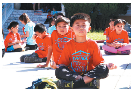
孩童在禪坐課學習培養定力。