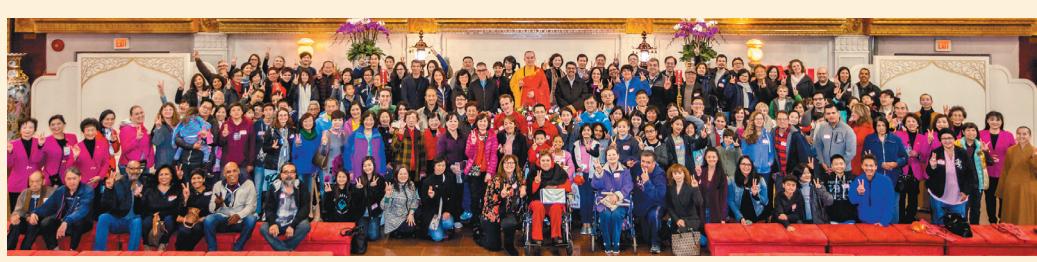
←大家聚集在大雄寶殿獻燈祈福，圖為大合照。