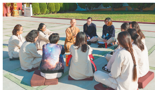
↑小組時間，青年分享所學所感，近距離向法師請益。