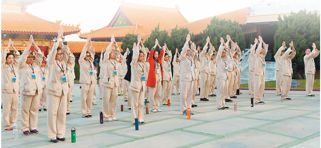
↑青年們體驗動中禪。