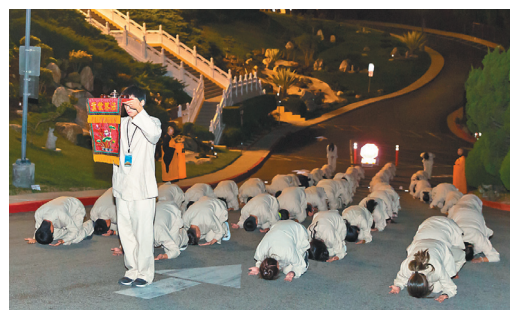
↑朝山活動，青年們在靜悄悄的夜裡，如法如儀地三步一拜。