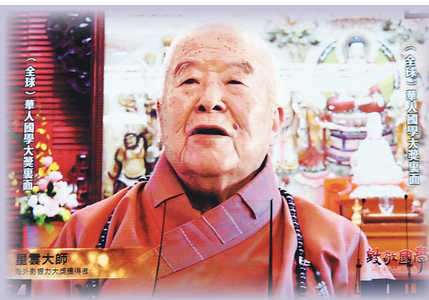
↑星雲大師榮獲「第二屆全球華人國學傳播獎」之「年度海外影響力大獎」，典禮中播放大師預錄致詞影片。