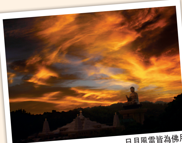
日月風雷皆為佛用