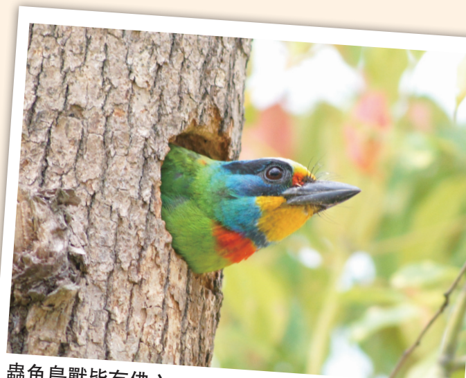
蟲魚鳥獸皆有佛心