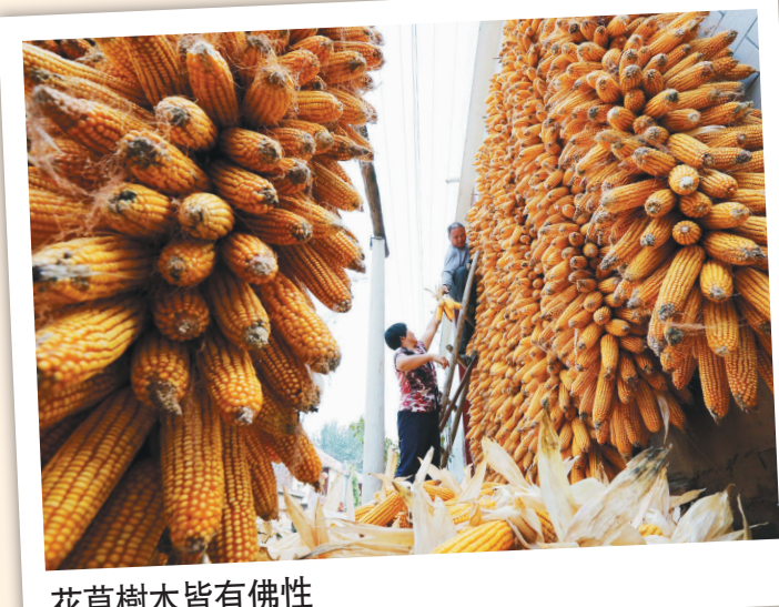
花草樹木皆有佛性