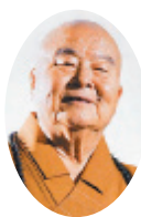
星雲大師/Venerable Master Hsing Yun

去除執著必有寬廣 體貼他人必有回報 知足淡泊必有靜慮 不動心念必有境界 尊重他人必有回敬