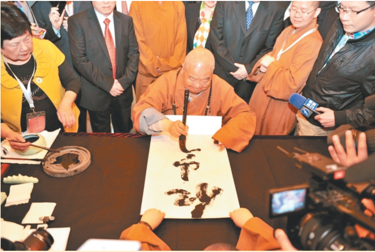
↑大師坐著輪椅，在長條桌前寫字，同時要有三名「書僮」伺候，沾墨、拉紙、移開完工作品，各司其職。圖爲二〇一四年一筆字在廈門市博物館開幕，星雲大師現場揮毫。