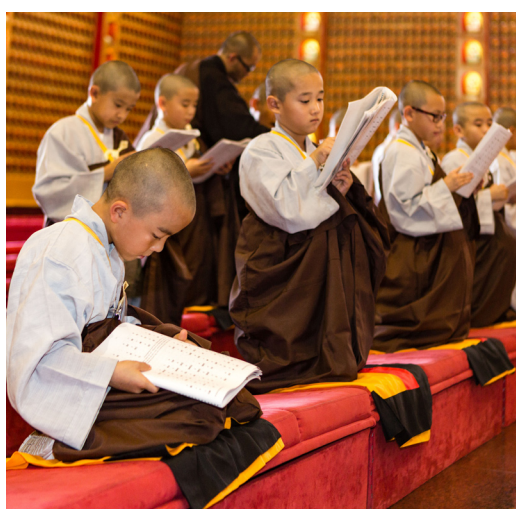
小男生自願發心剃髮出家，體驗佛門清淨生活。

家長紛紛表示，參加「青少年短期出家修道會」的孩子回家後，會自動自發幫忙做家務，更能自理生活，不但不會賴床，更將被子疊得整齊無比。家長對西來寺的生活教育非常讚歎，表示明年還會幫孩子報名，並向親朋好友介紹這個有意義的活動。