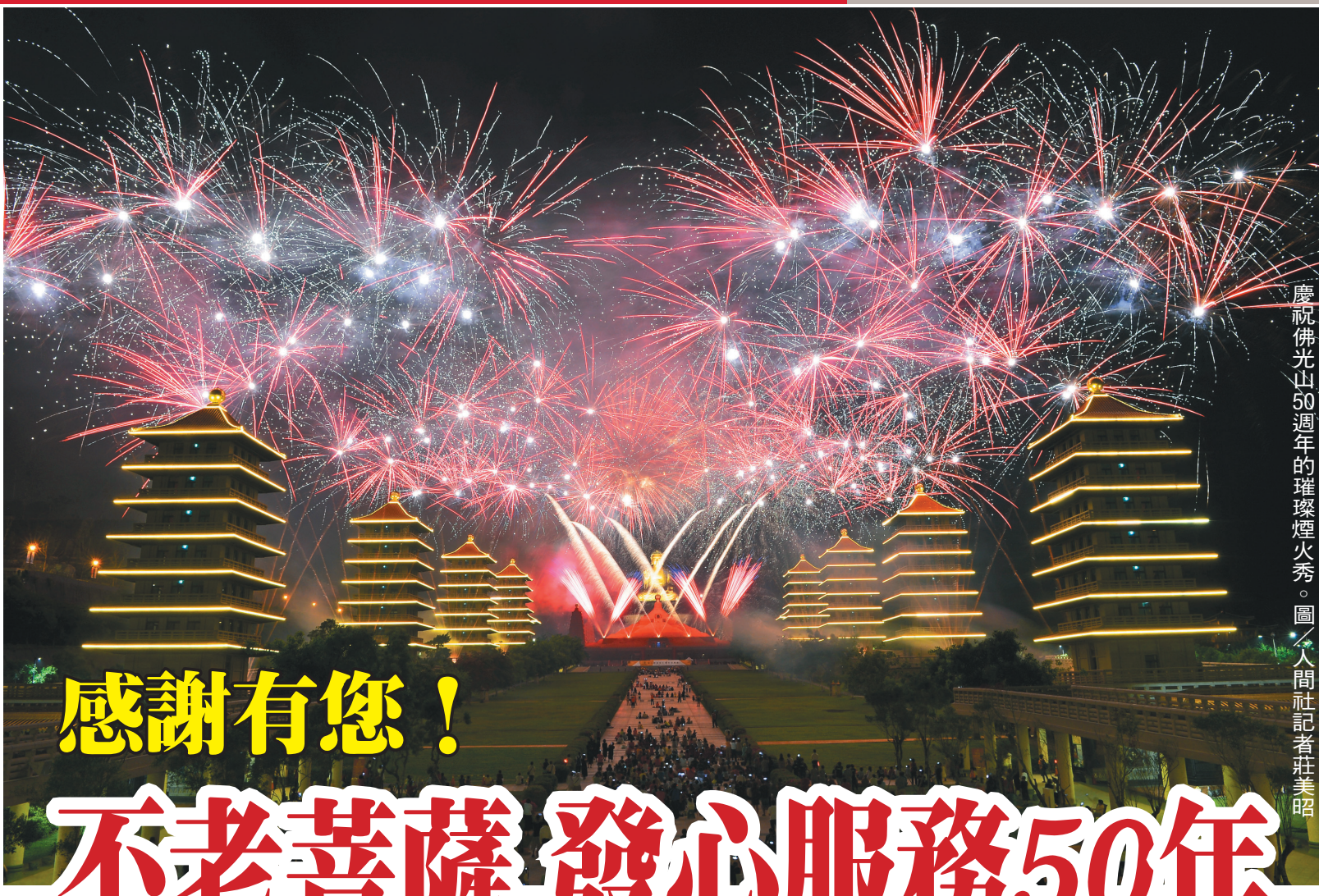
慶祝佛光山50週年的璀璨煙火秀。