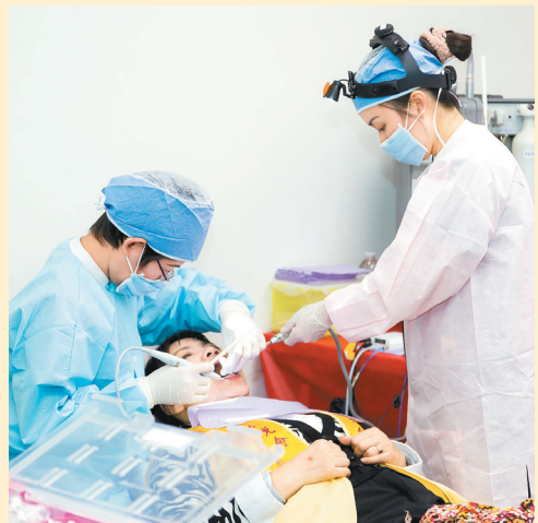
西來寺義診牙科提供一般牙齒保健、洗牙、補牙、拔牙、牙齒矯正及牙周病諮詢等。

西來寺地址：3456 Glenmark Dr., wHacienda Heights, CA 91745