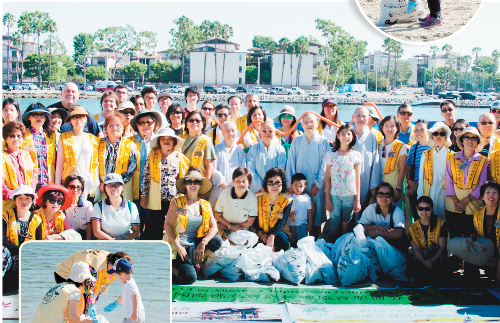
大家兵分多路，撿拾散落各處的塑膠與保麗龍製品、菸蒂等。約一小時後，義工們收集了十餘袋的垃圾，成果輝煌。