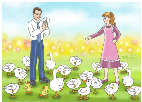
圖 / 道璞

讚美對於人是非常重要的，舉世滔滔哪一個人不希望獲得別人的讚美、肯定？所以，做人處事要想得到方便，有時候口中的一句好話，比出多少的力氣助人，力量還要來得更大。