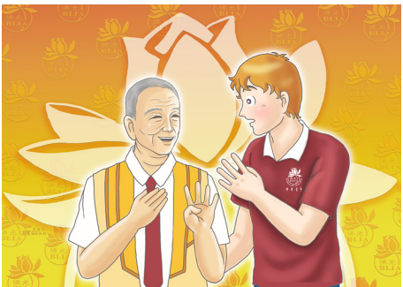
圖 / 道瑛

因此，做人只要對國家、社會有貢獻，只要能懂得慈悲為善，就算是只有一天的生命，也都是有價值的，何況是四歲的老翁呢？