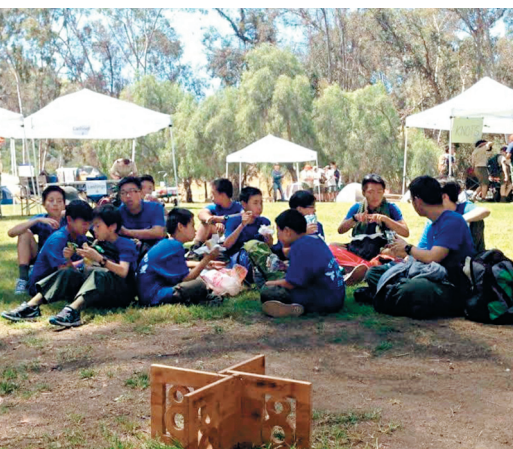
▲西來童軍團今年再傳捷報，12位大童軍榮獲第一名及第二名（Top Patrol President Award and The First Place）。西來童軍分鷹、龍兩組報名，鷹隊拿到9個最高分，龍隊緊追其後拿到6個最高分。