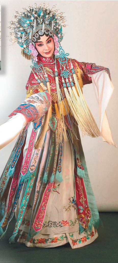
▲對於每齣戲的演出，黃宇琳都努力做到最好的表現。