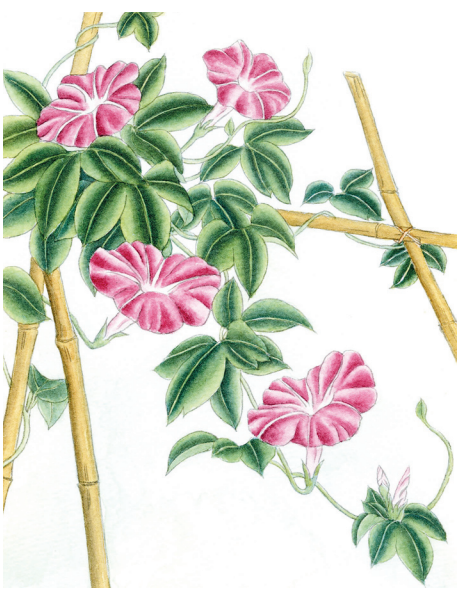
圖 / 心皓

「譬如大明中，有燈而無目」，沒有智慧，就無法了解佛法的真實義，猶如燈火通明，但沒眼睛的人是看不到的，縱然有再美的青山綠水，也無法欣賞。聽聞佛法也須有「智慧的眼睛」，才能把佛法深深流入心海，並付諸實踐，這樣才能真正受益。