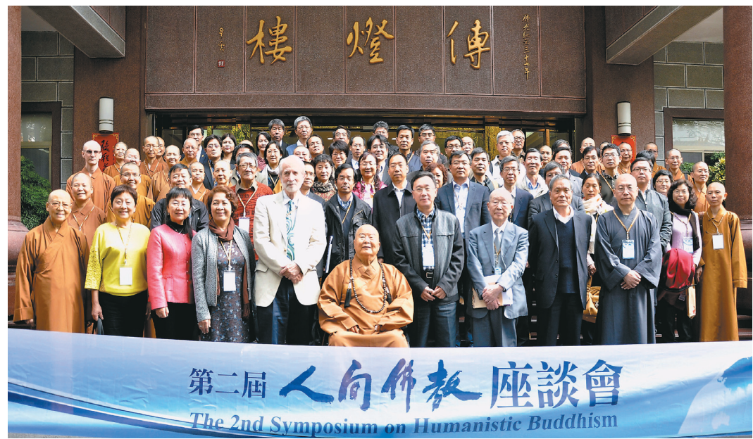
星雲大師（中）和與會學者、貴賓等，在佛光山傳燈樓前合影。

【記者羅智華高雄報導】何謂人間佛教？佛法該從何處求？為讓普羅大眾了解佛教真諦，佛光山開山星雲大師日前在台灣高雄佛光山，為第二屆人間佛教座談會、國際佛光會中華總會二〇一四年會員代表大會與全國幹部講習會，以「人間佛教的宗要」為題，闡述家國為尊、生活合理、人間因緣、心意和樂等四大要素，點出佛法要在人間奉行，勉勵大眾要實踐三好、四給、五和廣結善緣，利己利他。