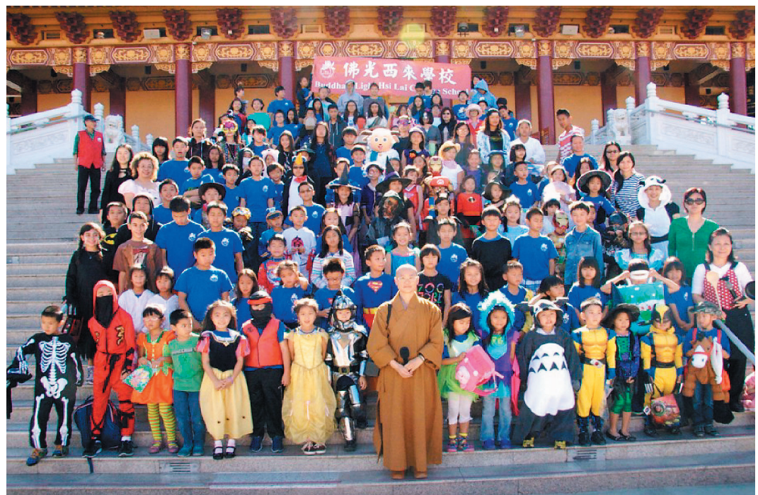
▼佛光西來學校師生與家長創意過節慶。