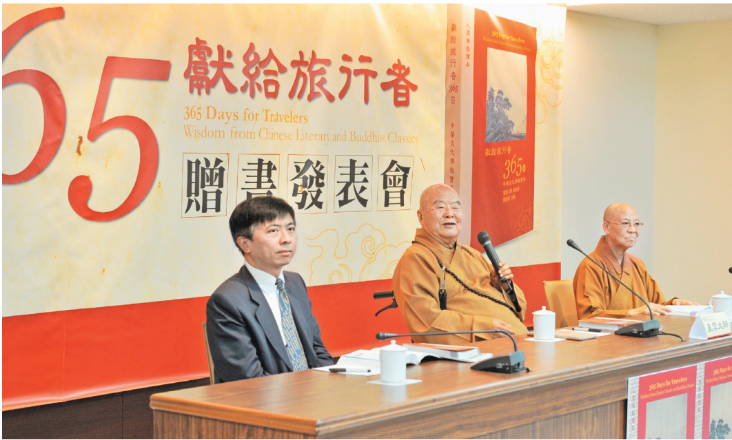
星雲大師（中）出席贈書發表會，左為雲朗觀光集團總經理盛治仁，右為國際佛光會世界總會副總會長慈容法師。

【記者羅智華台北報導】經常旅行的人都知道，各國旅館裡常擺放《聖經》供基督或天主教徒閱讀，但對其他信仰或一般民衆來說，卻始終沒有一本普及化的精神食糧來滋養旅途心靈，如今這樣的缺憾，將透過佛光山開山星雲大師總監修的《獻給旅行者365日—中華文化佛教寶典》獲得圓滿，未來這本書將以「只送不賣」的公益形式送往各國飯店、旅館，與所有旅人結緣，讓民衆在旅途中亦能汲取中華文化精華的智慧靈光。