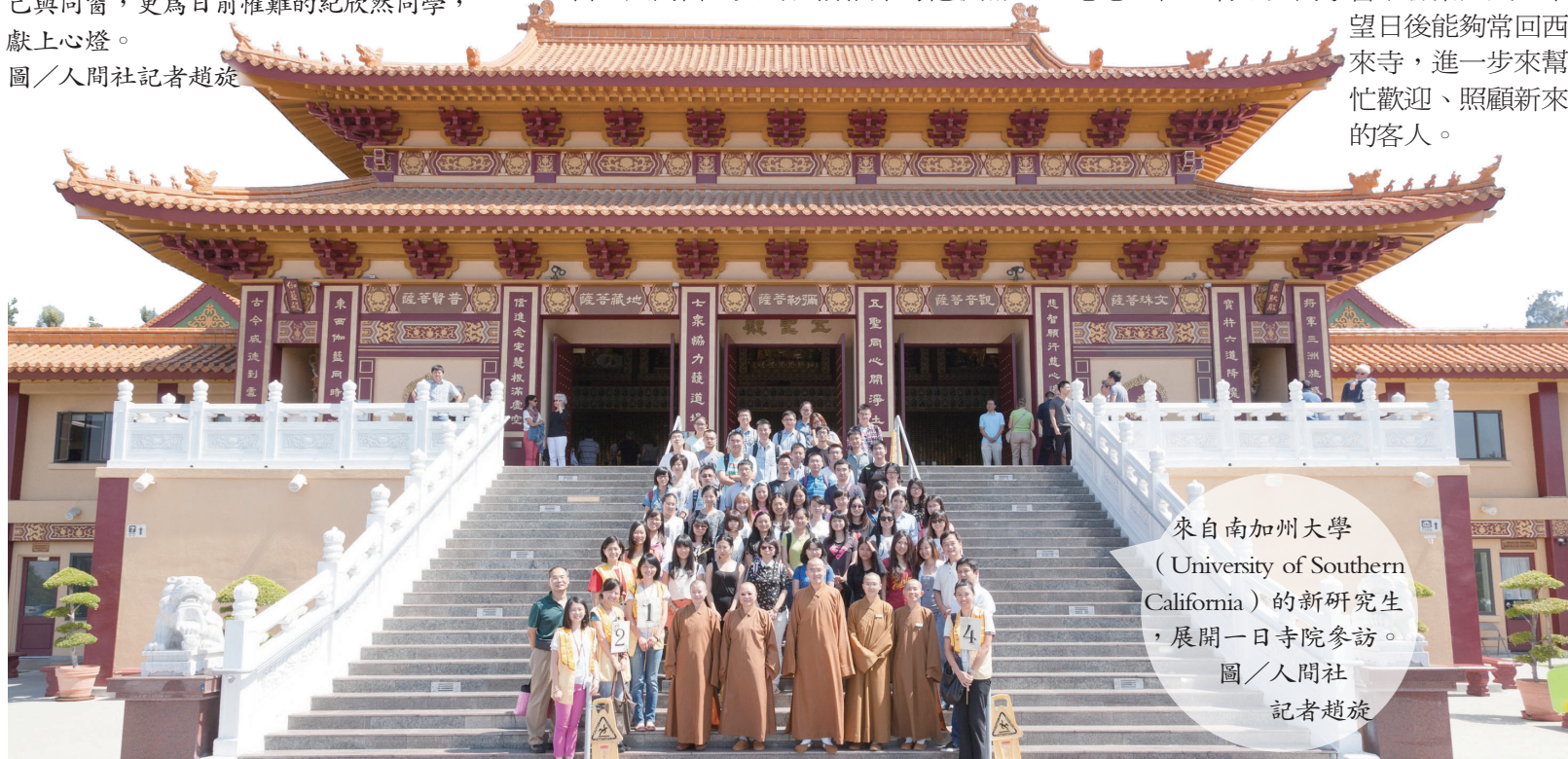
來自南加州大學（University of Southern California）的新研究生，展開一日寺院參訪。

西來寺是不少新同學在美國的第一關懷站，對於西來寺熱情提供的方便，他們很感恩，甚至有不少同學留下聯繫方式，希望日後能夠常回西來寺，進一步來幫忙歡迎、照顧新來的客人。