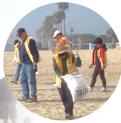
↑洛杉磯佛光人走在沙灘上，仔細的撿拾細碎的垃圾。

最後，長堤分會的會員們還帶來了美味佳餚與大眾分享，感恩大眾的發心幫助。長堤分會歷年來致力於組織大眾，參與淨灘等各類社區的服務活動，不斷提供大眾修習佛法的機會。之後，長堤分會將持續這樣的使命，讓更多的佛光人加入清理沙灘、清淨自心的活動。