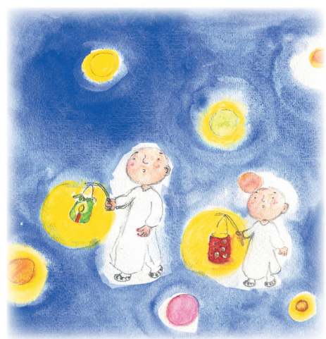
圖 / 妙顯

因此，修學佛法，首先要發菩提心，進而修習十善業，讓自己的信心不退轉，對佛道心生嚮往、歡喜，大乘佛道就在當下了！