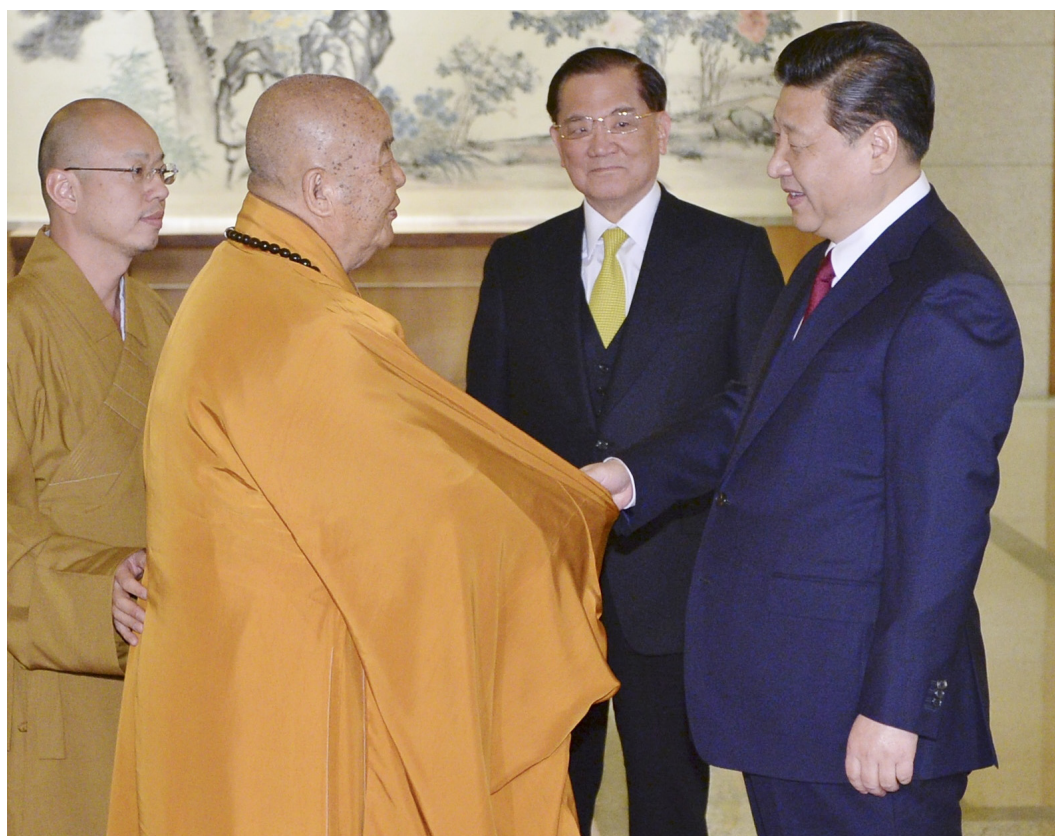
中共總書記習近平（右）在北京釣魚台國賓館，會見佛光山開山星雲大師。他對大師說：「你送我的書，我全都讀完了。」大師回應，「中國夢」帶給中國更偉大、富強的發展，令人激賞。

在上海書城，星雲大師的作品一年銷售總數超過兩千五百套。上海季風書園總經理于淼說，星雲大師的書是暢銷書，去年銷售前三名為《成就的祕訣》、《包容的