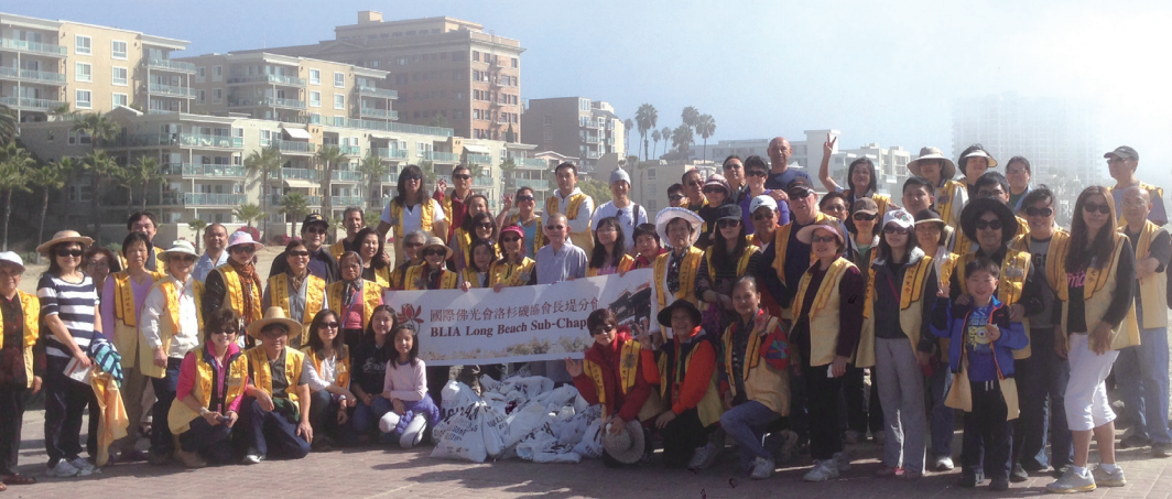
←在佛光人眼裡，沙灘上的垃圾就如心中的煩惱，需要將它們一一撿起、收拾、整理。