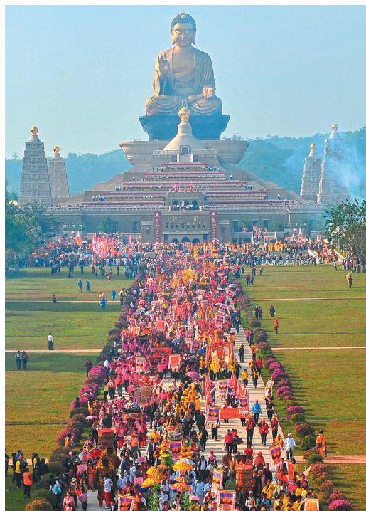
跨兩岸逾兩千尊神明，在台灣佛陀紀念館海會來集。

兩千餘尊來自各地的神明，下午在萬人照相台舉行「祈福法會」，由心保和尚引領萬眾唱念〈佛寶讚〉與星雲大師所撰〈為社會大眾祈願文〉；接續回鑾儀式，由