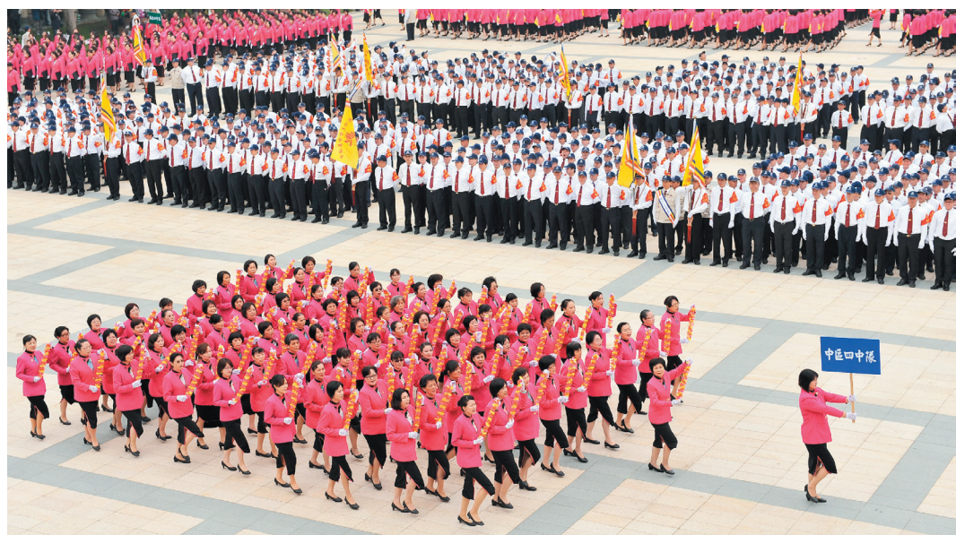
陣容浩大的佛光知賓，以整齊步伐通過司令台時，贏得許多掌聲。圖 / 人間社記者莊美昭

【記者郭書宏高雄報導】國軍閱兵大典已不是新鮮事，但你看過佛教師兄、師姐踢正步，接受檢閱的盛況嗎？